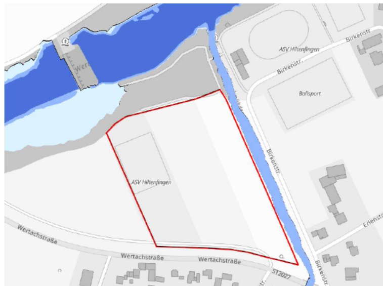
Abb. 5: Hochwassergefahrenflächen im Vorhabenbereich

Der Geltungsbereich liegt außerhalb von Überschwemmungsgebieten und Hochwassergefahrenflächen. (s. Abbildung 5).