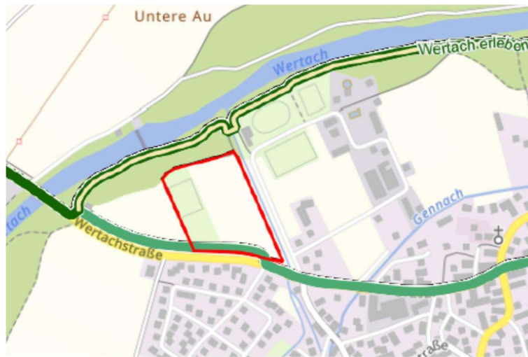
Abb. 6: Radwege im Vorhabenbereich (BayernAtlas, © Bayerische Vermessungsverwaltung 2025)

Schutzgebiete gemäß BNatSchG sind innerhalb des Planungsraumes nicht vorhanden. Als Erholungseinrichtung bzw. -anlage ist im Planungsraum ein Ballspielplatz vorhanden. Radwege verlaufen südlich und nördlich des Vorhabensgebietes, weitere Erholungseinrichtungen bzw. -anlagen sind nicht vorhanden.