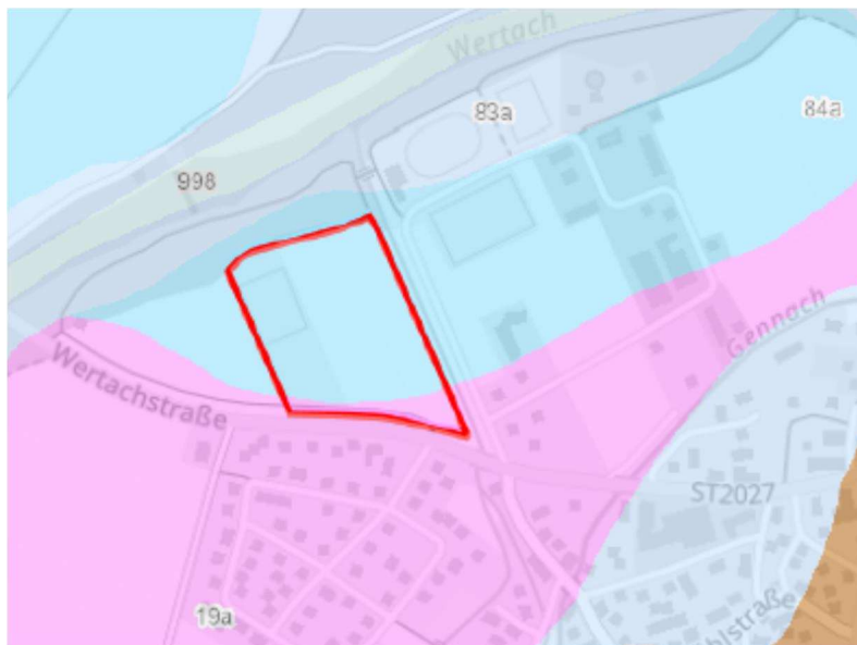
Abb. 4: Böden im Vorhabenbereich (BayernAtlas, Übersichtsbodenkarte von Bayern 1:25.000, © Bayerische Vermessungsverwaltung 2025, Bayerisches Landesamt für Umwelt)

Im Nahbereich der Wertachstraße wären „fast ausschließlich Pararendzina aus flachem kiesführendem Carbonatlehm (Flussmergel oder Schwemmsediment) über Carbonatsandkies bis -schluffkies (Schotter)“ vorhanden (s. Abbildung 4, Kartiereinheit 19a).