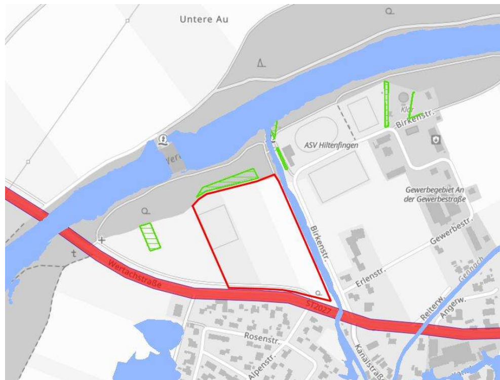
Abb. 2: Schutzgebiete / -ausweisungen

Innerhalb des Planungsraumes sind weder Schutzgebiete gemäß BNatSchG oder amtlich kartierte Biotope noch Flächen gemäß DSchG oder Wasserschutzgebiete vorhanden (s. Abbildung 2).